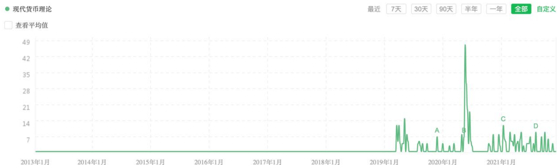
图2 “现代货币理论” 360 搜索热度变化

关于现代货币理论的争论同样蔓延至我国。2020年5月《国际经济评论》编辑部主办的关于“财政赤字货币化”线上研讨会及其催生的大量政策论争，更是使现代货币理论被聚焦于镁光灯之下，成为了我国宏观经济讨论的重要话题。下图2、3的360搜索热度指数和百度搜索热度指数，在一定程度上反映了“现代货币理论”在我国这些年获得的这种关注情况的变化。